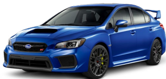
Синий перламутр Rally (WR Blue Pearl)