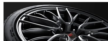
18" легкосплавные диски STI