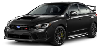
Черный металлик (Crystal Black Silica)