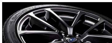
18" легкосплавные диски