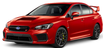
Красный (Pure Red)