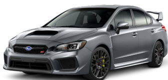
Серебристый металлик (Ice Silver Metallic)