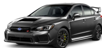
Темно-серый металлик (Dark Gray Metallic)