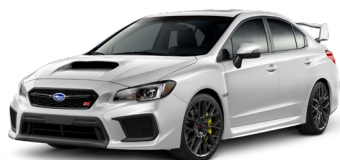
Белый перламутр (Crystal White Pearl)