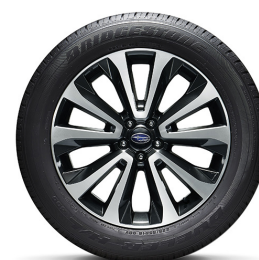
18" легкосплавные диски**