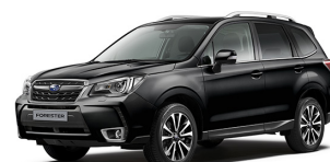
Черный металлик (Crystal Black Silica)