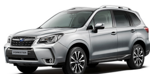
Серебристый металлик (Ice Silver Metallic)