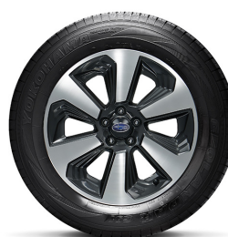
17" легкосплавные диски**