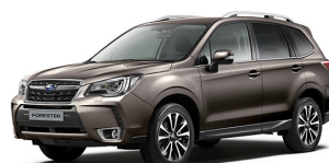
Серо-бежевый металлик (Sepia Bronze Metallic)