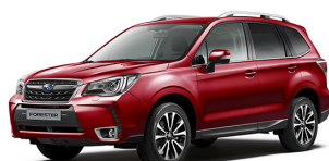
Красный перламутр (Venetian Red Pearl)