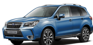
Синий перламутр (Quartz Blue Pearl)