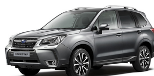
Темно-серый металлик (Dark Gray Metallic)