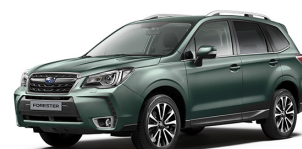
Светло-зеленый металлик (Jasmine Green Metallic)