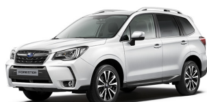
Белый перламутр (Crystal White Pearl)