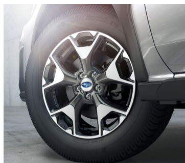
17" легкосплавные диски