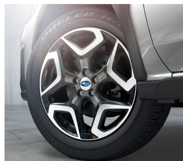
18" легкосплавные диски