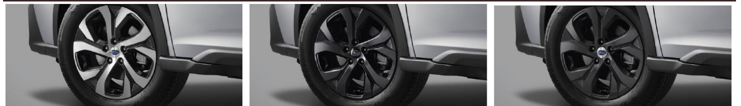
18" легкосплавные диски (комплектация 4G)